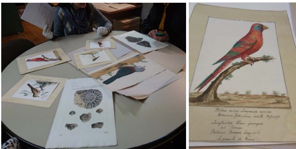
Donación de láminas de la Colección Van Berkhey sustraídas en los años 80 del s. XX