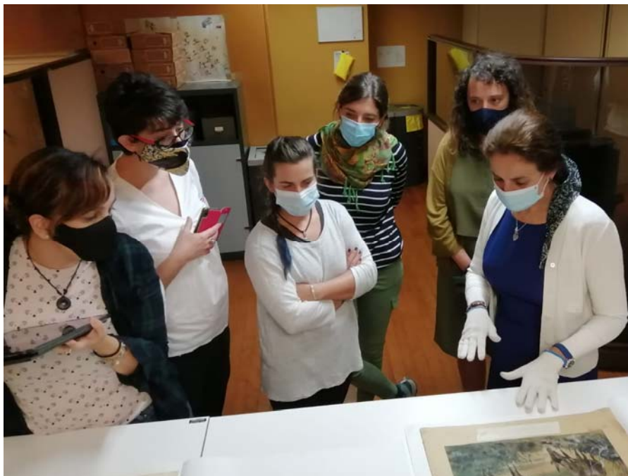
Visita al Archivo de los alumnos de Ilustraciencia.