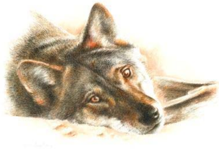
Loba descansando. Plumilla y tinta china color sobre papel, Nacho Zubelzu.