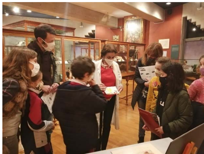
“Noche Europea de los Investigadores” (2020).

Actividad: A través de las reproducciones de distintos dibujos y grabados de invertebrados marinos se explica a los asistentes que, pese a su apariencia de plantas, los distintos ejemplares son animales.