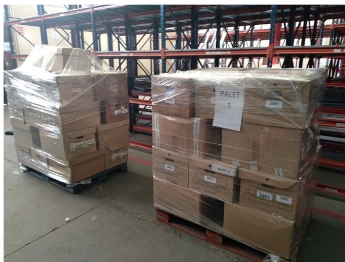
Donación Repsol: Fotos aéreas de la Península Ibérica (vuelo 1956-1957): 41 cajas