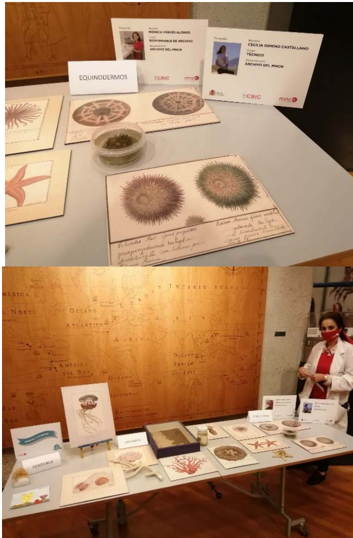
Piezas utilizadas en la “Noche Europea de los Investigadores” (2020).