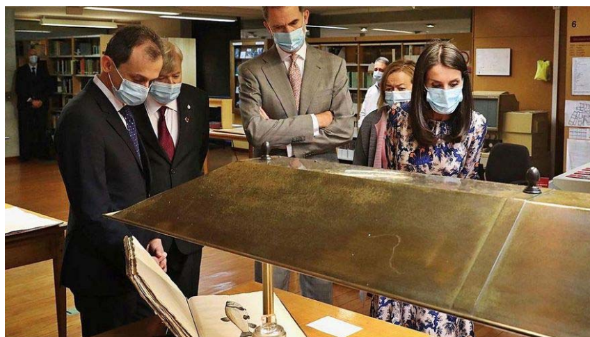
Visita de los Reyes de España al Museo Nacional de Ciencias Naturales. Viendo piezas de la Biblioteca y el Archivo.